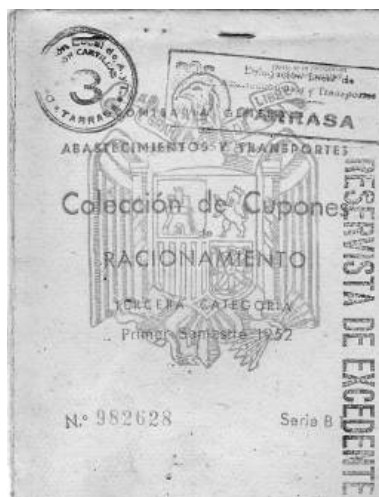
Imagen 2. Cartilla de racionamiento.

Las acusaciones y persecuciones, la arbitrariedad y el terror definen una época de carestía y necesidad. Así, la economía del hambre no deja de ser otra cara de la represión. Las cartillas de racionamiento y las estrategias de resistencia y supervivencia darán como resultado la reactivación de la práctica del contrabando y la aparición del estraperlo: